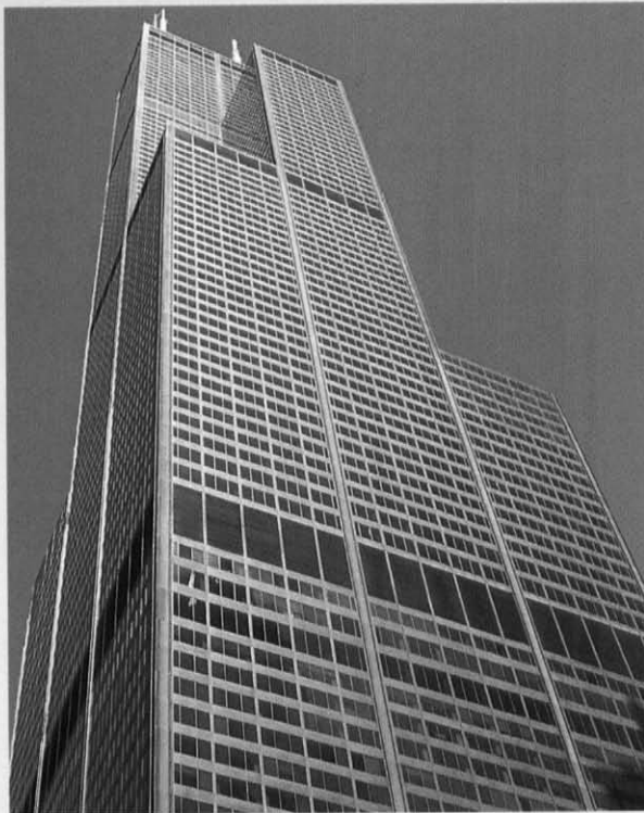
Torre Sears, Chicago