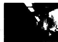
Centro de oportunidades en Southall