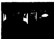
Sony Europe Finance