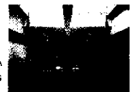
GCA Arquitectes Associats

Maqueta 1:1, y continuamos trabajando 82