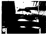
Meyocks & Priebe Advertising