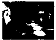
Alliance Communications Corporation