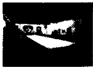
Ammiratis Pluris Lintas