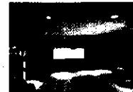
Rhino Entertainment Company