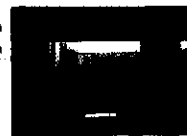
Oficinas en Diagonal Minerva