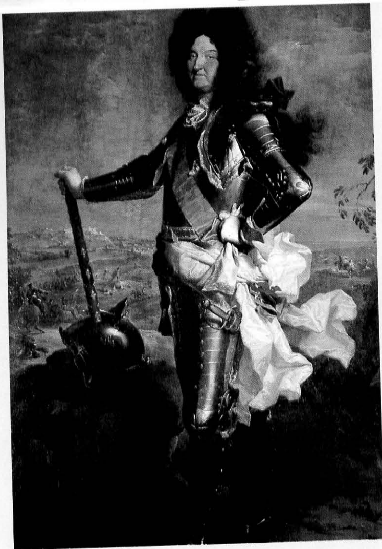
Retrato de Luis XIV por Hyacinthe Rigaud (Museo del Prado, Madrid).

Francia en la guerra de los Treinta Años Los tratados de Westfalia