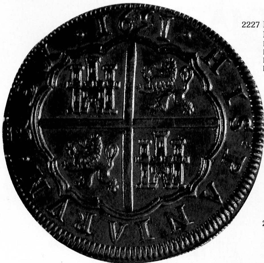
Real de a ocho castellano (Gabinete Numismático de Cataluña, Barcelona, España).

El ciclo del cobre La recuperación de la plata y el oro Devaluaciones generalizadas