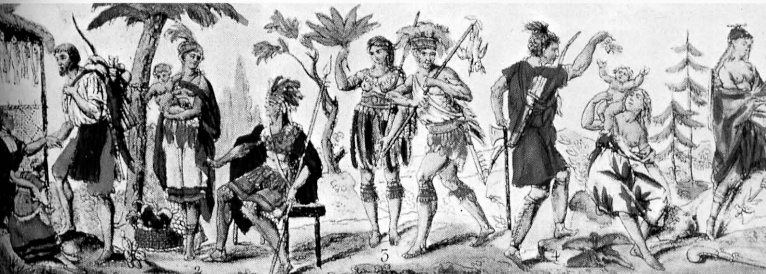
Detalle de un grabado que representa las diferentes etnias que poblaban América en el siglo XVII (Colección particular, Madrid).

Intervención de los Países Bálticos en la guerra