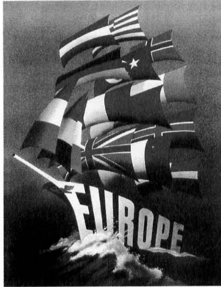
Cartel del plan Marshall. Sólo Europa se benefició de la ayuda norteamericana. Los soviéticos la rechazaron.