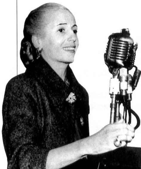
Eva Duarte de Perón se apropió de la palabra «descamisados» y la utilizó como propaganda.