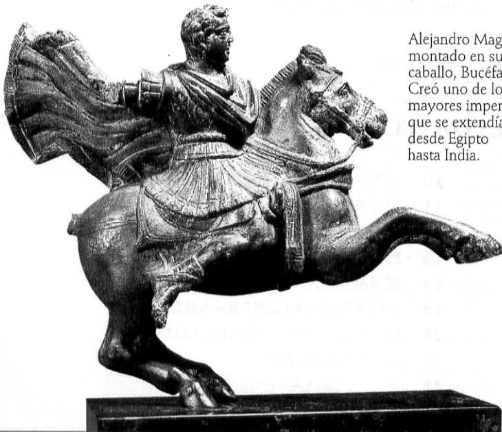
Alejandro Magno montado en su caballo, Bucefalo. Creó uno de los mayores imperios, que se extendía desde Egipto hasta India.