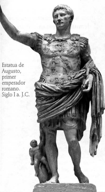
Estatua de Augusto, primer emperador romano. Siglo I a. J.C.

El quinto emperador de Roma • Un príncipe clemente y virtuoso • La edad de oro de Nerón • De Roma a Nerópolis • Realizar lo increíble • Alarma entre los conservadores • El fin del sueño