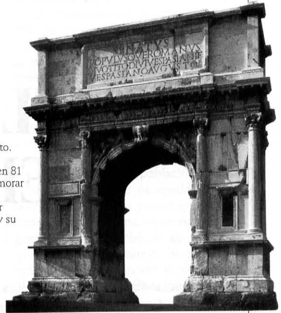
El arco de Tito. Erigido por Domiciano en 81 para conmemorar la toma de Jerusalén por Vespasiano y su hijo Tito.