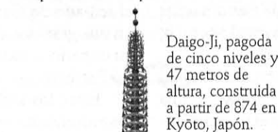
Daigo-Ji, pagoda de cinco niveles y 47 metros de altura, construida a partir de 874 en Kyôto, Japón.

La promesa de Eduardo a Guillermo • La recuperación del poder en Normandía