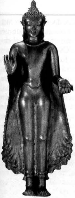
Buda de pie, al estilo de Pagan. Los fundidores birmanos gustaban de budas de hombros redondeados.

LA EDAD CLÁSICA DE ASIA ..... 706-709 Pagan, capital de Birmania • Anorahtha, rey budista • Angkor, la ciudad de los dioses • La prosperidad comercial de Java ANGKOR VAT ..... 710-711