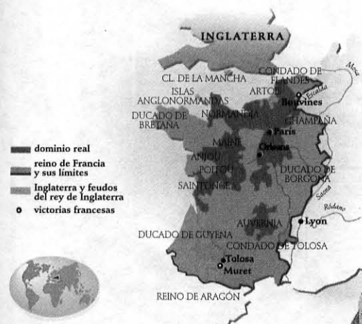
LA FRANCIA FEUDAL

1224 - 1250 EL FINAL DE LOS CÁTAROS ..... 762-767 Cátaros, patarinos y albigenses • La cruzada de los señores feudales • La victoria de los Capetos • La Inquisición • El final de los cátaros