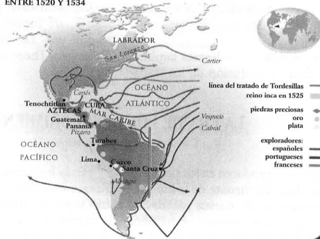
LAS CONQUISTAS ESPAÑOLAS EN AMÉRICA CENTRAL Y SUR ENTRE 1520 Y 1534