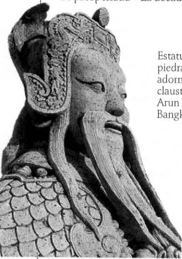
Estatua china de piedra que adornaba el claustro del Wat Arun en Bangkok.

Felipe II el Atrevido, el fundador • Los años de prosperidad • La decadencia de Borgoña