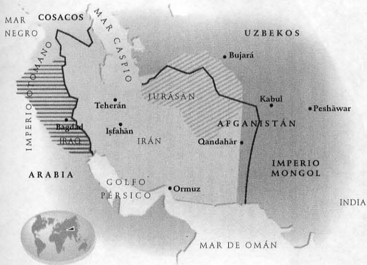
EL IMPERIO PERSA

imperio persa en el siglo XVI zona disputada entre uzbekos y şafawīes conquistas de los otomanos Imperio persa hacia 1722