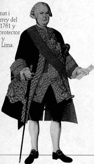
Manuel Amat i Junyent, virrey del Perú entre 1761 y 1776. Fue protector de las artes y embelleció Lima.

EL FIN DEL ESPLENDOR ITALIANO ..... 1366-1369 La evicción y el regreso de España • Italia desgarrada por la guerra • El eclipse de las potencias locales • Italia se abre a la Ilustración • El fracaso económico