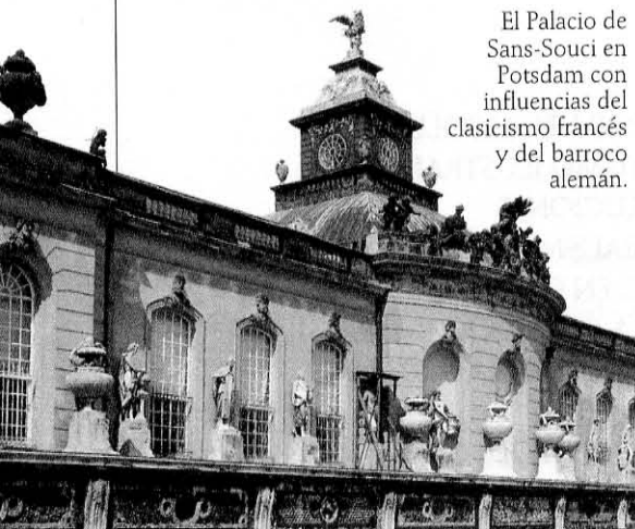
El Palacio de Sans-Souci en Potsdam con influencias del clasicismo francés y del barroco alemán.

La guerra civil • Los príncipes del Norte • La sublevación de los campesinos • El principado del Sur • La expansión de Vietnam