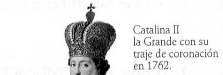
Catalina II la Grande con su traje de coronación en 1762.

El mundo de los salones • El confort y la elegancia • Ciudadanas y campesinas • La maternidad • El abandono de niños