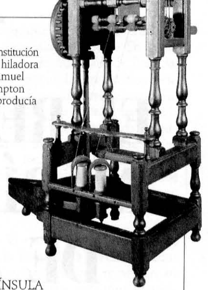
Reconstitución de la hiladora de Samuel Crompton que producía hilo.

LA PENÍNSULA INDOCHINA ..... 1390-1393 El fin del reino de Ayudhiā • El reino de Bangkok • La pujanza de Siam • El apogeo de Vietnam GEORGE WASHINGTON ..... 1394-1397 Jefferson y Hamilton • Republicanos y federalistas • Las victorias de los federalistas • Washington desautorizado