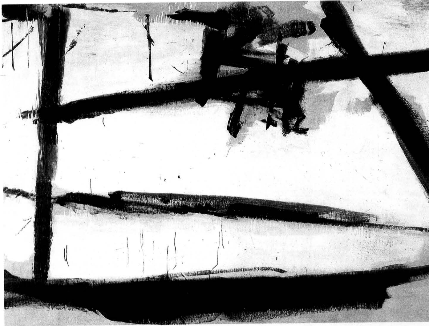
Detalle de la Pintura número 2 (1952) de Franz Kline. En esta obra, conservada en el MOMA de Nueva York, se observa la intensa energía gestual de los trazos pictóricos.