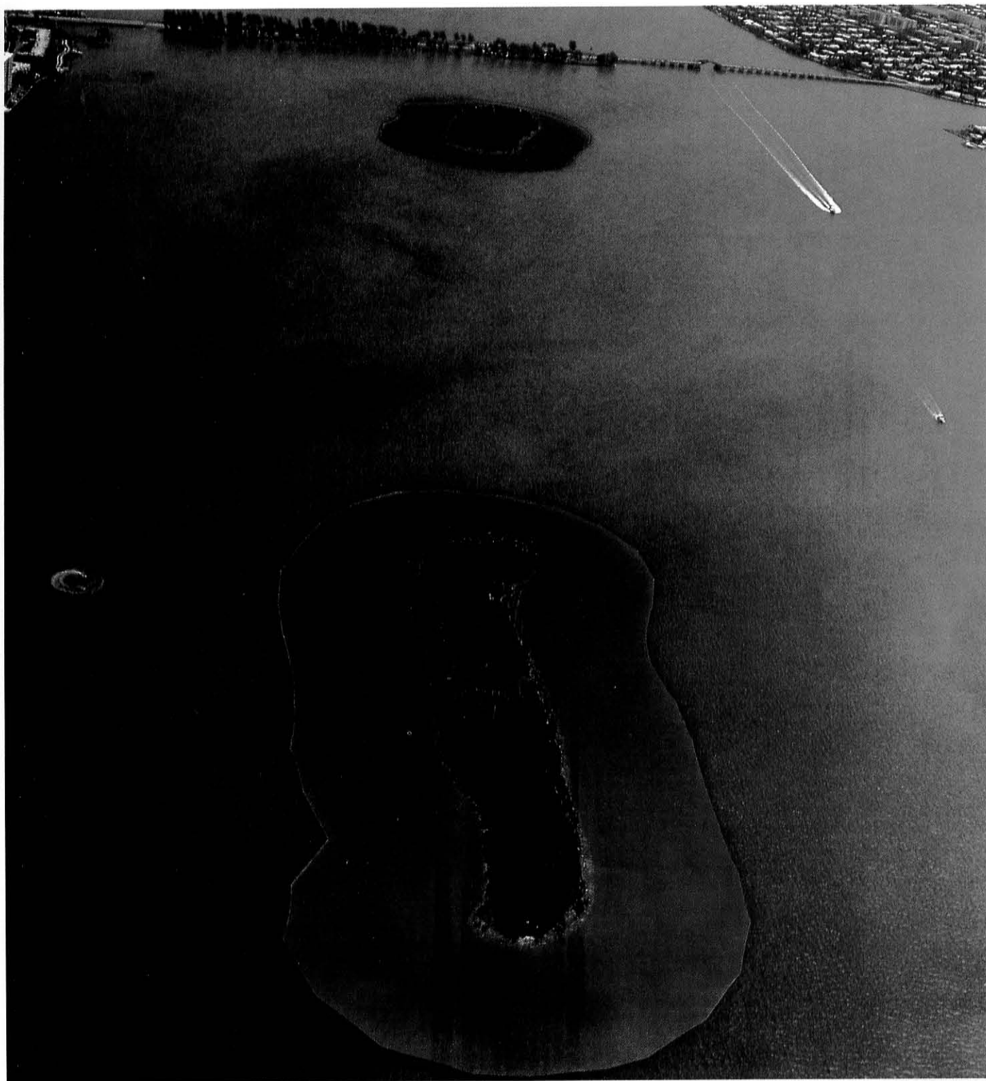
Arriba, Islas rodeadas , una intervención realizada en 1980-1983 por el estadounidense de origen búlgaro Christo y Jeanne-Claude, sobre las once islas de Biscayne Bay (EE UU), a las que rodearon con una tela rosa.