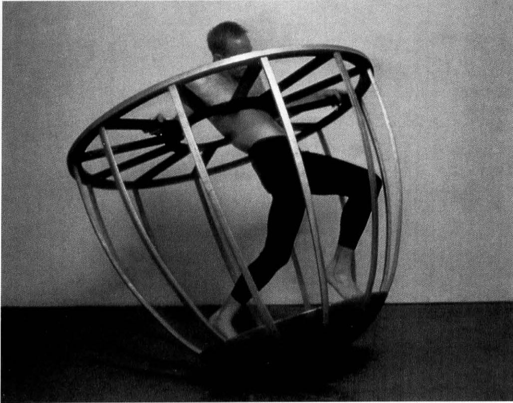
A la izquierda, obra en madera de Jana Sterbak titulada Sisifo (1990). La artista se basa aquí en el mito clásico para reflejar la absurdidad de los esfuerzos y afanes del hombre contemporáneo.