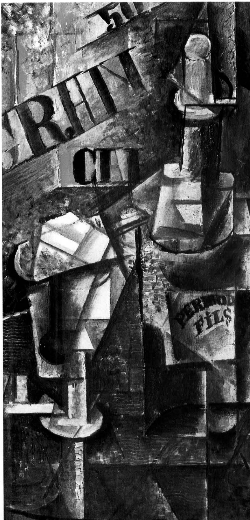
Fragmento de la obra cubista Botella de Pernod (1910-1912), de Picasso, que se conserva en el Museo del Ermitage de San Petersburgo (Rusia).